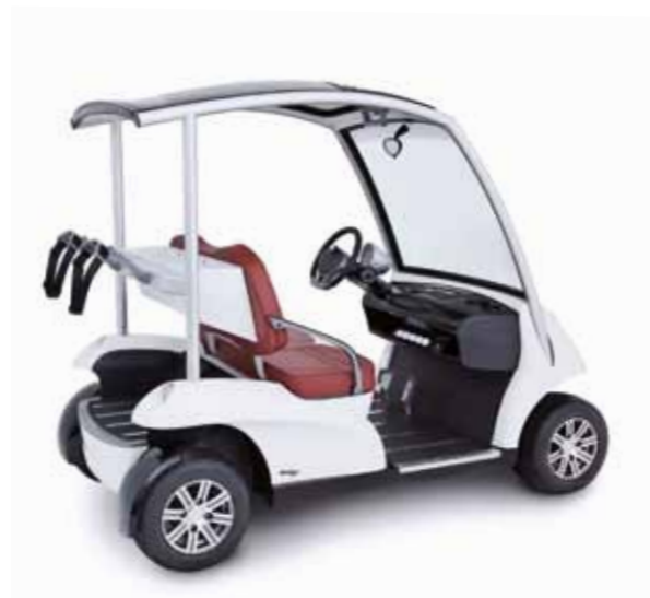
上图白色车身, 樱桃红标准座椅, 非升级版.